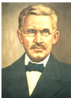
Friedrich Wilhelm Raiffeisen (* 30.03.1818, † 11.03.1888)